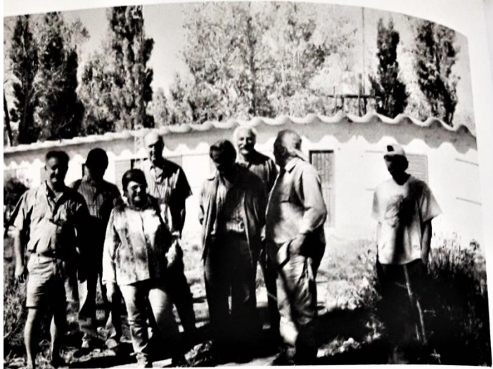
INSTITUTO DE REHABILITACION ARROYITO. Año 2000.