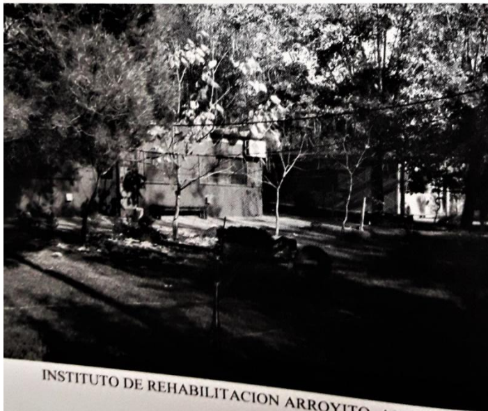
INSTITUTO DE REHABILITACION ARROYITO. Año 2013.