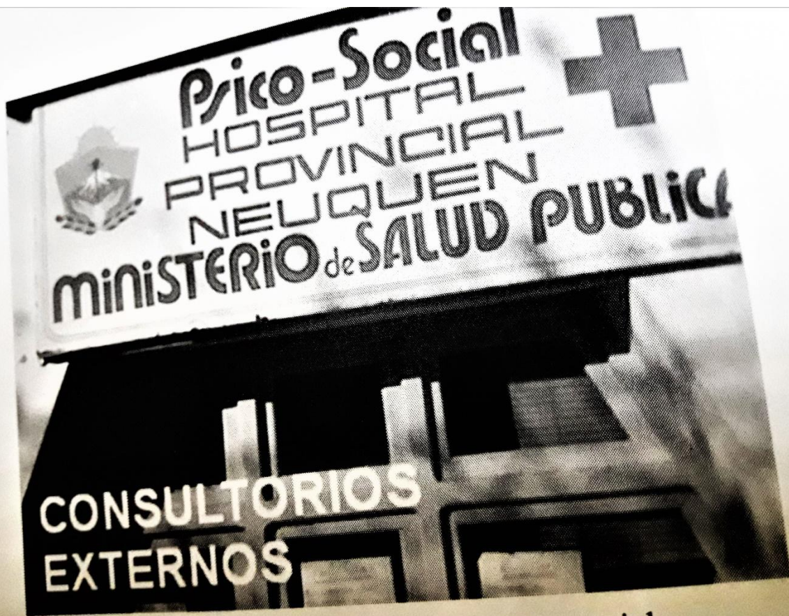
Ingreso a Consultorios externos Psicosocial