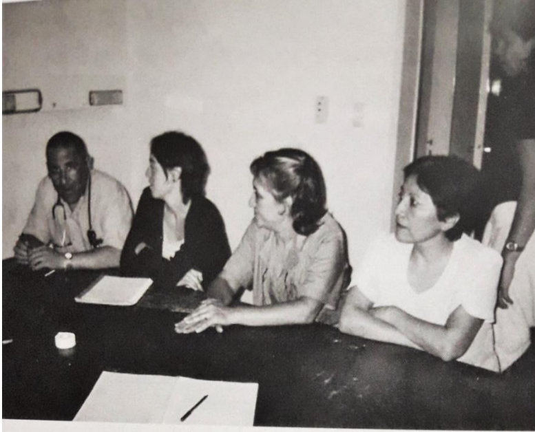
Internación en ADOS